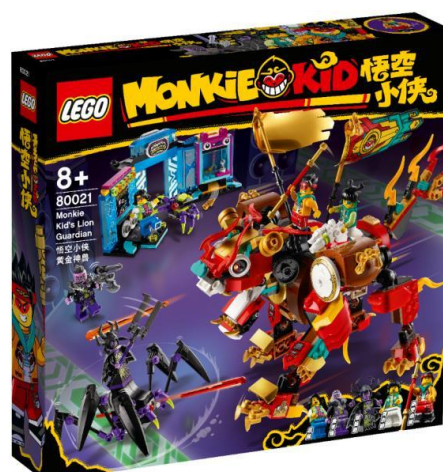
80021 モンキーキッドのライオン・ガーディアン