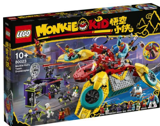
80023 モンキーキッドのドローンバスター