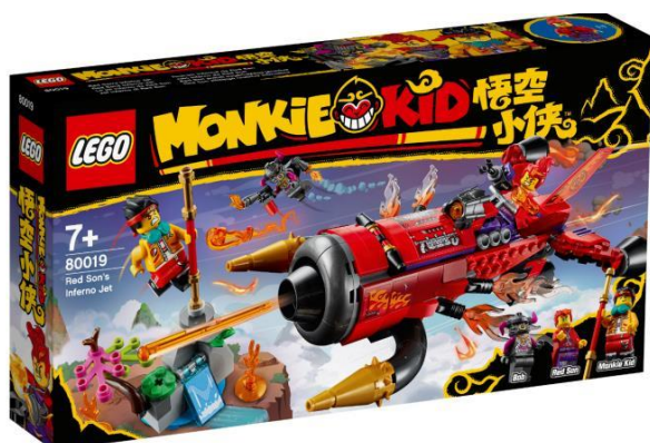
80019 レッドサンのブラスター・ジェット