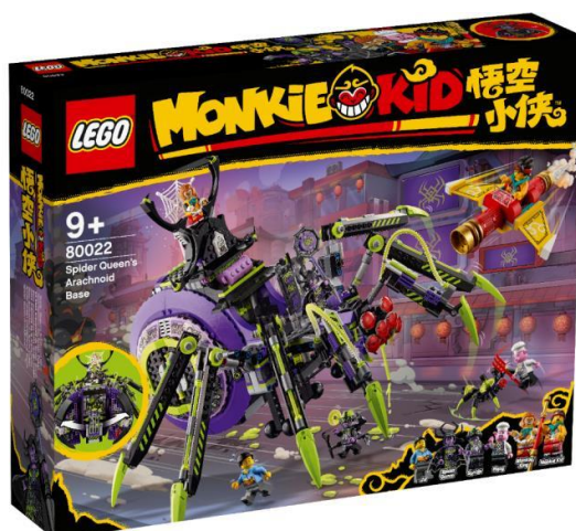
80022 スパイダークイーンの最恐基地