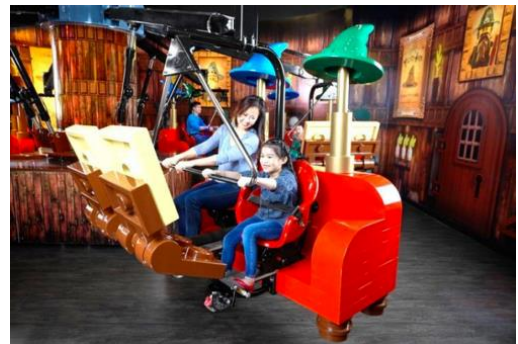
マーリン・アプレンティス