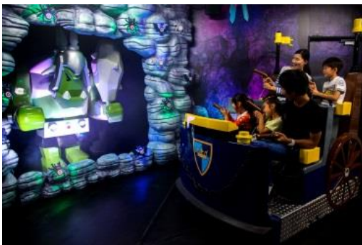
キングダムクエスト