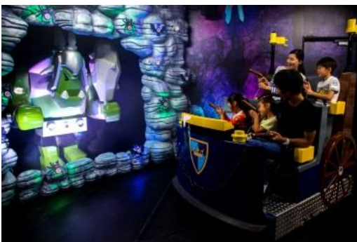
キングダムクエスト