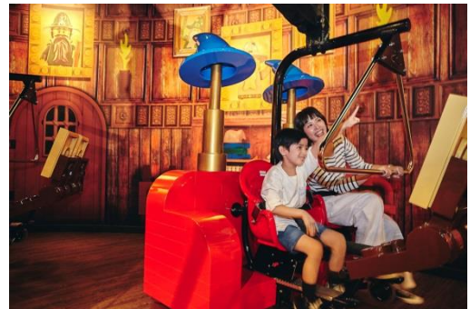
マーリンアプレンティス