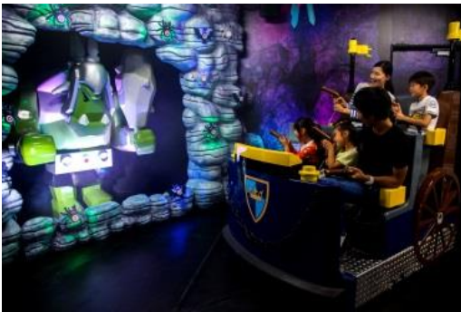
キングダムクエスト