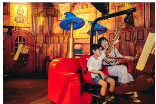
マーリンアプレンティス