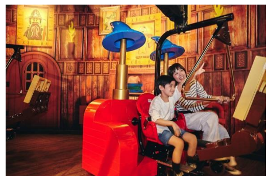
マーリンアプレントイス