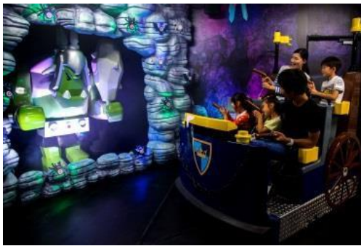
キングダムクエスト